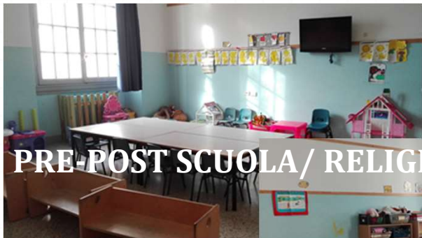
PRE-POST SCUOLA/ RELIGIONE